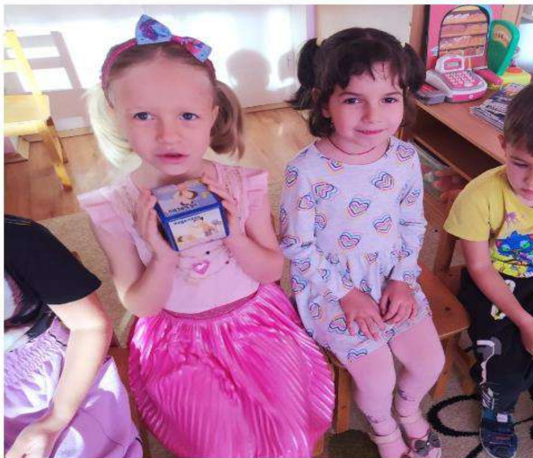
Составляем рассказ о папе